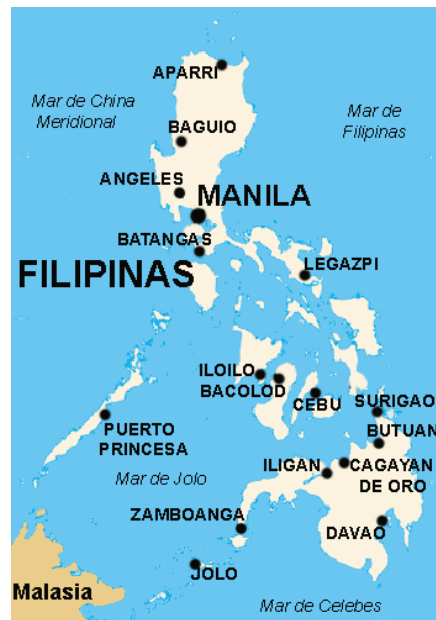
Territorio de Filipinas.

-Educación: la educación primaria es el primer nivel de la educación obligatoria y está dirigida a los niños que han cumplido los seis años, aunque pueden ser admitidos desde los cinco años. La educación primaria se extiende hasta el 6° año, sin embargo, algunas escuelas primarias también pueden impartir los cursos de la escuela intermedia (7° y 8° grados). Las escuelas secundarias normalmente proporcionan educación a partir del grado 9° hasta el 13°. En algunas zonas rurales las escuelas proporcionan los tres tipos de educación en una sola institución.