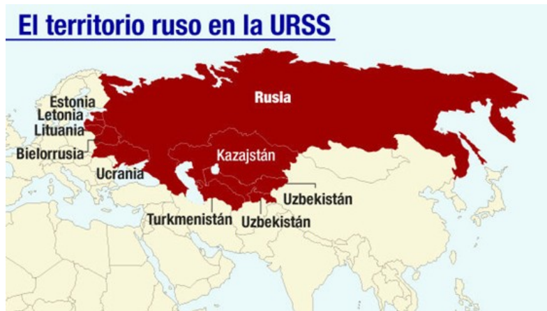
Territorio de la URSS