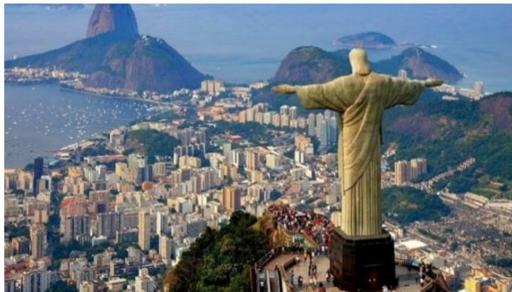
Río de Janeiro, ciudad más turística de Brasil.

-Medio ambiente: Muchos de los cambios que están ocurriendo en la actualidad es debido a la intervención humana en diferentes regiones. Se ha podido notar como los indicadores ecológicos han variado constantemente llegando al punto de crear diversas iniciativas ambientales. México es un país el cual no es la excepción de notar como el medio ambiente sufre diferentes cambios. Es por eso por lo que se ha visto en la necesidad de buscar medidas que ayuden a proteger al medio ambiente.