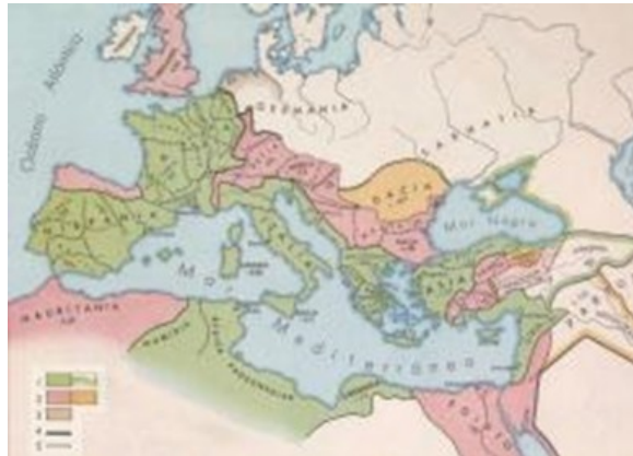
El imperio romano en su máxima extensión.