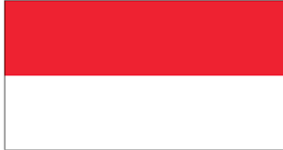
Bandera de Indonesia.

emisiones actuales de Indonesia surgen de la deforestación y de la degradación forestal.