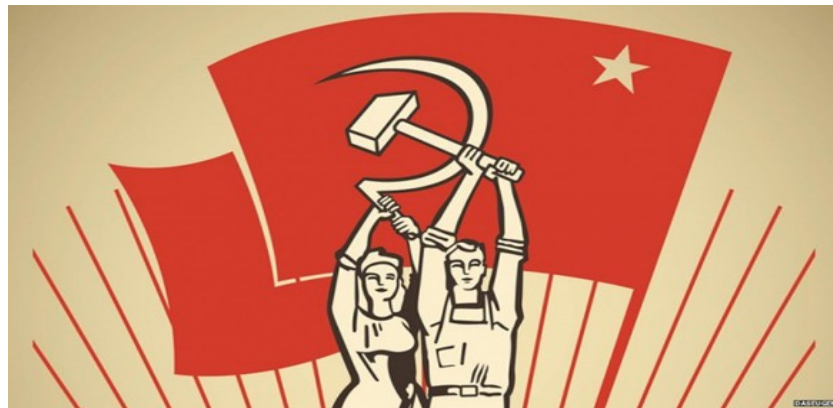
Símbolos del comunismo en la bandera de la URSS