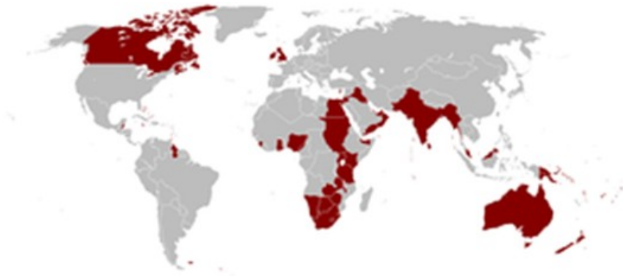
El imperio británico en su máxima extensión